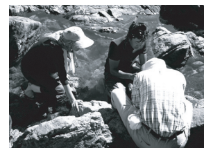
原発建設予定地の生物調査

山口県上関町には今でも自然海岸が残る美しい海があります。そこには瀬戸内海の生態系のホットスポットと呼ばれる程多様な希少生物が命を育んでいます。そしてその海に寄り添うように人々も生活し、文化を育んできました。しかし、その海岸に28年前、上関原発が計画されました。人々は賛成派、反対派に二分され、人間関係もぎくしゃくしたものにならざるをえなくなりました。そして地元・祝島の人々を中心に建設反対の声が高まっているにもかかわらず、2009年10月、埋め立て工事が始まり、生態系や人々の生活が破壊されようとしています。今、温暖化など環境問題の深刻さ、地方の活性化、公共事業見直しが叫ばれる中、新たな原発建設は必要なものでしょうか？同じ瀬戸内海でつながっている大阪と一緒に考えてみましょう！