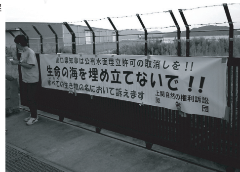
「生命の海を埋め立てないで!!」